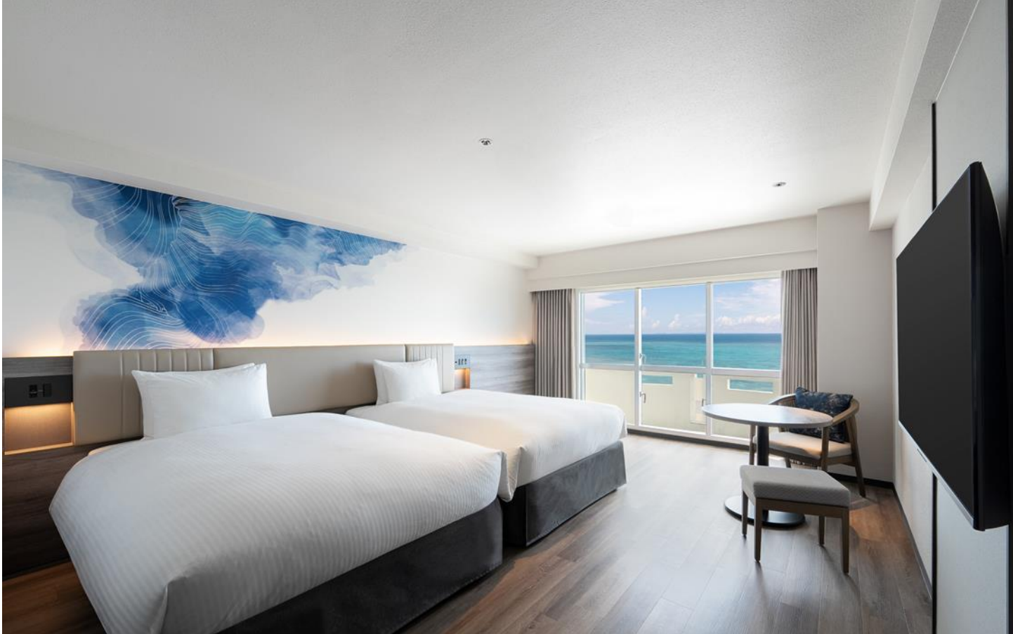
Superior Twin Room