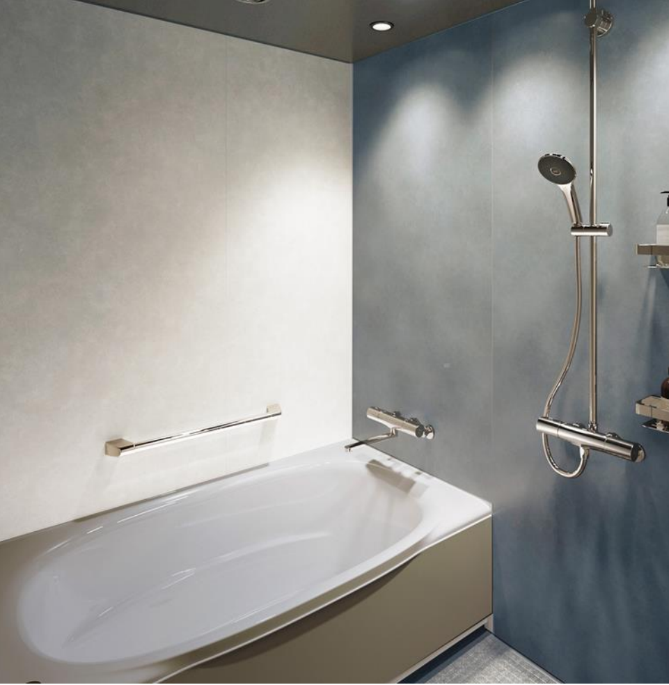
Superior Twin Room