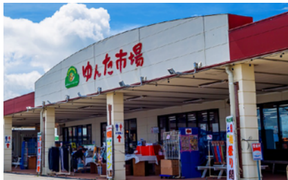
読谷ファーマーズマーケット ゆんた市場

読谷村の農家から直接届いた野菜や果物のほか、沖縄や読谷村ならではの素材を使用した加工食品やお土産も並びます。また、総菜や弁当、ご当地スイーツなどもあり、毎日地元の人と観光客の多くの人々で賑わっています。同敷地内には読谷観光協会やフードコート「ゆんたまーさむん小路」もあり地元の食文化を満喫できます。