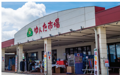
読谷ファーマーズマーケット ゆんた市場

読谷村の農家から直接届いた野菜や果物のほか、沖縄や読谷村ならではの素材を使用した加工食品やお土産も並びます。また、総菜や弁当、ご当地スイーツなどもあり、毎日地元の人と観光客の多くの人々で賑わっています。同敷地内には読谷観光協会やフードコート「ゆんたまーさむん小路」もあり地元の食文化を満喫できます。